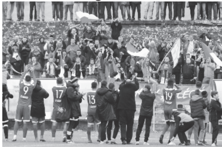
Hangos a sepsiszentgyörgyi szurkolótábor, a csapat pedig köszöni: a tabellán negyedik az OSK. Nem csoda, hogy nehezen nyelik le a román szurkolók, hogy immár egy másik székelyföldi csapat is helyet követel magának a hazai foci élvonalában

A pályán kívül folytatódott szombat délután a Brassói FC és Sepsis OSK 2. ligás labdarúgó-mérkőzés. A döntetlenre végződött mérkőzés lefújása után a brassóiak keresték az „összecsapás” lehetőségét a mintegy 500 fős háromszéki szurkolótábor tagjaival, és csendőrségi közbelépésre volt szükség, hogy a vendégeknek ne essen bántódásuk.