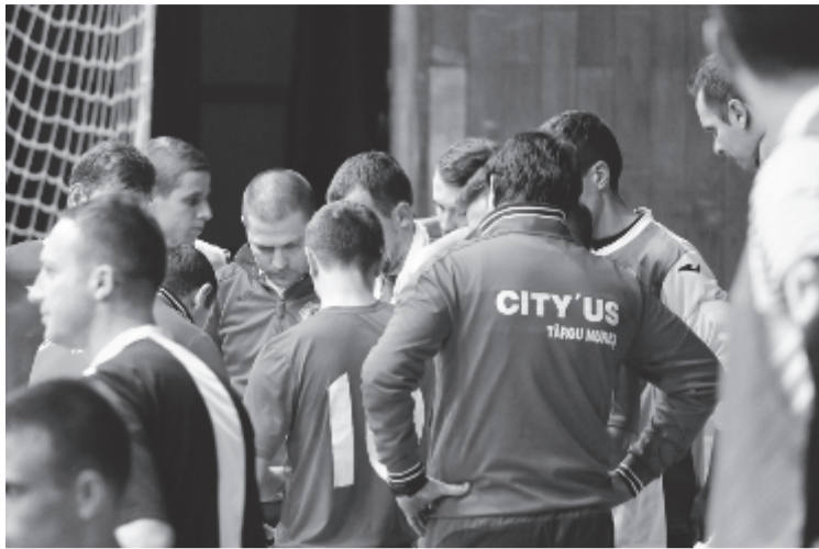
A szakvezetés próbálta felrázni a marosvásárhelyi fiúkat, de nem sikerült.

Tény, hogy Călărași-on roppant nehéz nyerni, a műanyag borítású csarnok a legtöbb vendégcsapatnak nem kedvez, kikapott itt Te-