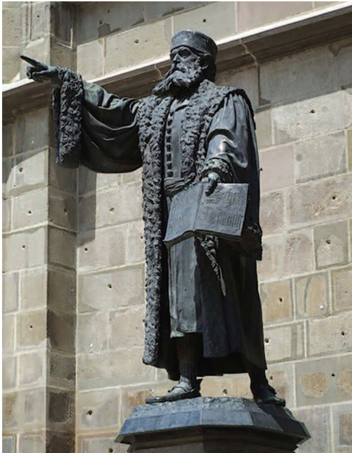
JOHANNES HONTERUS szobrát születésének 400. évfordulóján 1898-ban állították fel Brassóban, a szász evangélikus főtemplom (Fekete-templom) déli-nyugati tornyának déli homlokzata előtt. A bronzszobor a berlini szobrász Harro Magnussen alkotása. A reformátor jobb kezével a róla elnevezett iskolára mutat, bal kezében a reformációról szóló könyvét tartja.